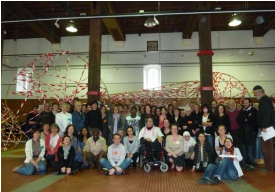
Les participants au séminaire

Le chantier est porté par une plate forme de 7 partenaires : ATD quart monde, IRDSU (inter réseau de professionnels du développement social urbain, FCPE (fédération des conseils de parents d'élèves), PRISME, les PEP (pupilles de l'enseignement public, la Fédération des centres sociaux et l'ACEPP (association des collectifs enfants, parents, professionnels). Ces 7 partenaires composent le comité de pilotage, et l'équipe projet national, dont les membres sont issus de ces réseaux. 22 sites, à travers tout le territoire, ont répondu à un appel à projet en novembre 2009 pour participer à cette aventure. Que ce soit pour l'équipe projet national, ou pour les équipes locales, des bénévoles comme des professionnels s'investissent ensemble. Ils cherchent des partenariats variés pour faire vivre et diffuser le chantier. Ainsi la ville de Nantes a été co-organisatrice de ce séminaire.