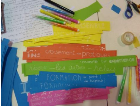
Animation proposée par la Luna

Comment réussir ce partenariat entre tous les acteurs de l'éducation, avec des parents reconnus à part entière ? Avec quels moyens ? Comment faire naître le besoin et l'envie de construire à plusieurs, et de se situer en coéducateurs... Comment se mettre d'accord ensemble sur un objet de travail commun en lien avec la situation éducative et sociale du quartier ?