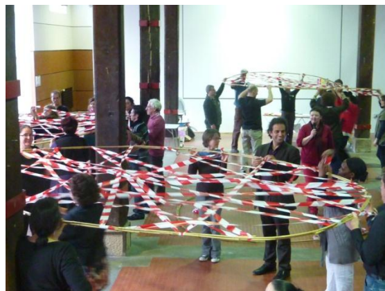
Projet artistique autour du lien

Nous avons retrouvé le rituel du repas coopératif. Chaque participant est venu avec un plat coloré à partager. De même, la Luna nous a proposé des moments de rencontre, autour de jeux, de création artistique. Plus généralement, les temps informels, et conviviaux entre les participants leur ont permis d'échanger, de créer des liens, de partager des expériences. Une dynamique de construction commune du chantier a pu s'installer durant ces deux jours.