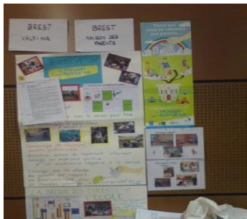
Panneau du marché des expérimentations