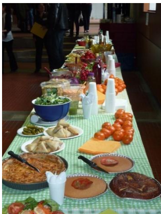
Repas coopératif du jeudi

Leur démarche : « Mettre en valeur la chaîne de production solidaire nécessaire à la réalisation de tout projet artistique. Mettre en place des instants fragiles, moments surprises, des bricoles éphémères, installer nos espaces à vivre, à nourrir, ménager des temps de rencontre, de parole à investir... »