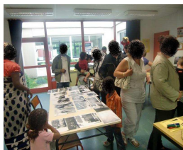
Séance sur les représentations autour de la « Réussite » juin—sept 2010

Objectif : installer un « vrai » dialogue au service de la réussite des enfants et des jeunes qui permettra à la Ville de Guéret et ses partenaires d'orienter leurs propres actions.