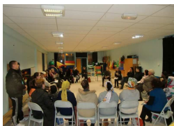
Rencontre des différents groupes de travail, le 15 février 2011